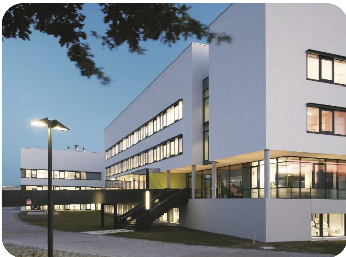
Unser Standort in Münster